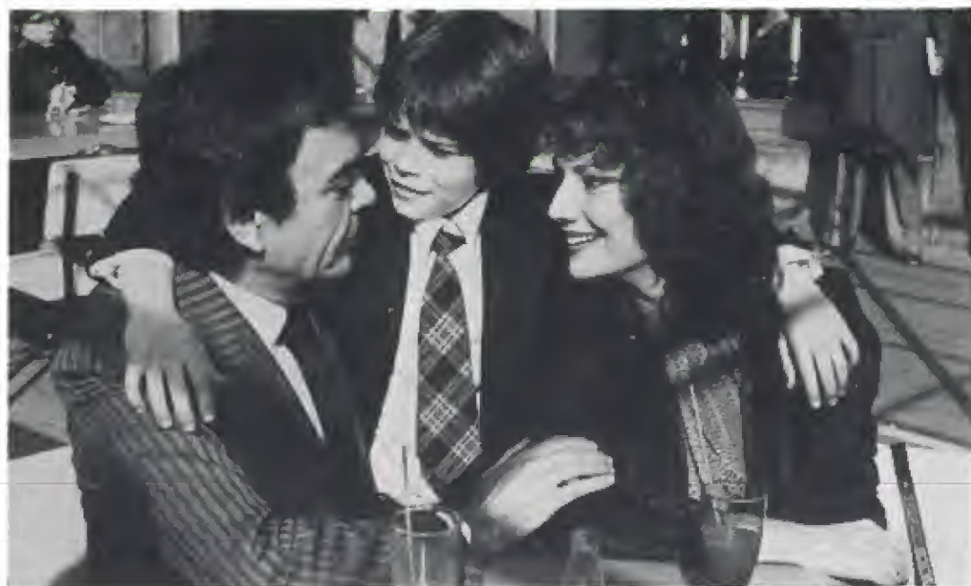
Paco Morán - Jorge Sanz - Paca Gabaldón